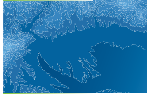
Sistemas de Información Geográfica