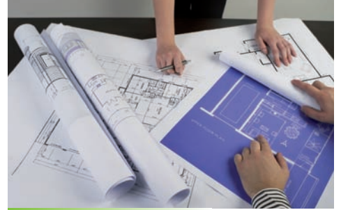
Documentos Técnicos - Infraestructuras