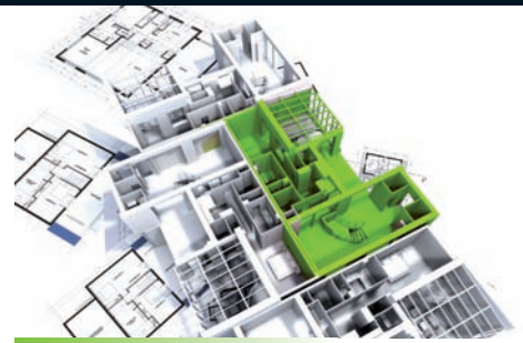
Arquitectos - Ingenieros - Contratistas