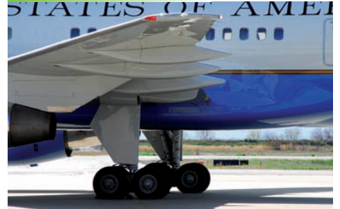
Administraciones - Ayuntamientos