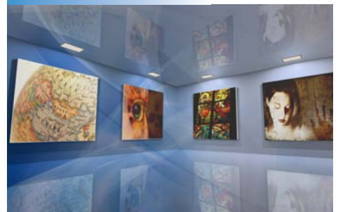
Museos, Bibliotecas, Galerías de arte