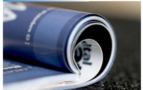
Servicios de manipulación