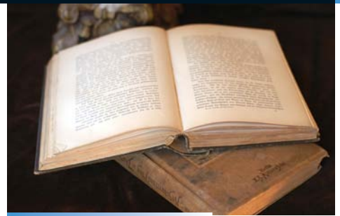
Objetos irregulares - Libros - Materiales Frágiles